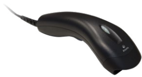
Scanner codici a barre