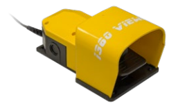
Input a pedale