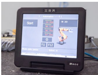
PC con Windows Embedded