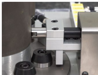
Compensazione automatica della temperatura